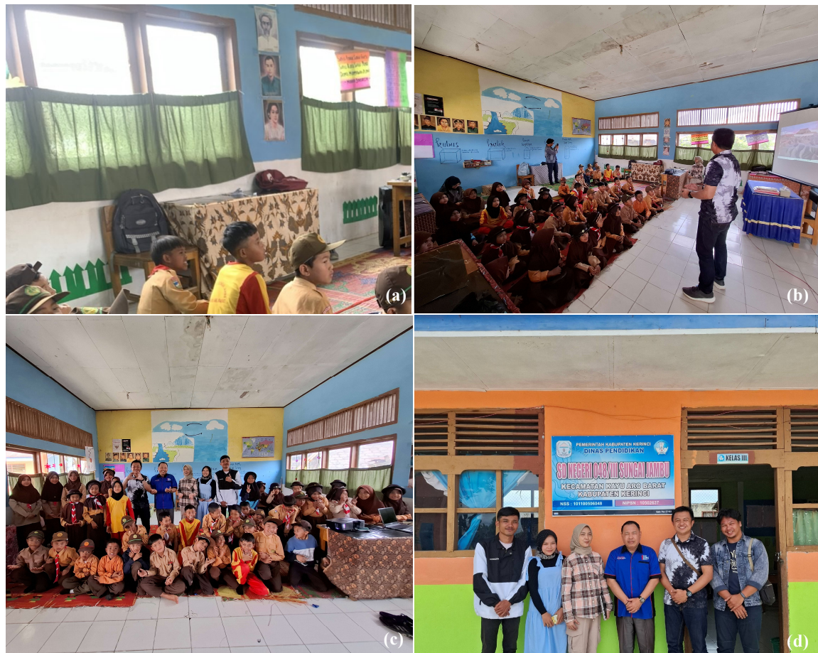
Gambar 3. Pelaksanaan Pengabdian Kepada Masyarakat dengan Tema Pengenalan Teknologi Digital Berbasis Bencana bagi Siswa. (a) Antusias Siswa dalam Mendengarkan Penjelasan, (b) Pemaparan Materi dan Pengenalan INARISK, (c) Foto Bersama Peserta Setelah Kegiatan, (d) Foto Bersama Kepala Sekolah SDN 48/III Sungai Jambu.

Pelaksanaan kegiatan ini dimulai dengan pengenalan teknologi digital berbasis bencana melalui aplikasi INARISK. Pembelajaran dimulai dengan penjelasan mengenai konsep dasar bencana alam dan risiko yang dapat terjadi di sekitar siswa. Pembelajaran ini kemudian dilanjutkan dengan demonstrasi aplikasi INARISK yang memungkinkan siswa untuk melihat langsung data risiko bencana di daerah mereka dan memahami bagaimana langkah mitigasi dapat diterapkan berdasarkan data tersebut. Risiko bencana yang ditinjau pada demostrasi ini adalah bencana letusan gunungapi dan gempabumi. Kedua jenis bencana ini dipilih berdasarkan tingkat risiko di kayu aro barat yang pernah diteliti sebelumnya oleh Sefiyanti (2024) terkait gempabumi. Secara keseluruhan, kegiatan pelaksanaan kegiatan ini tergambar pada Gambar 3.