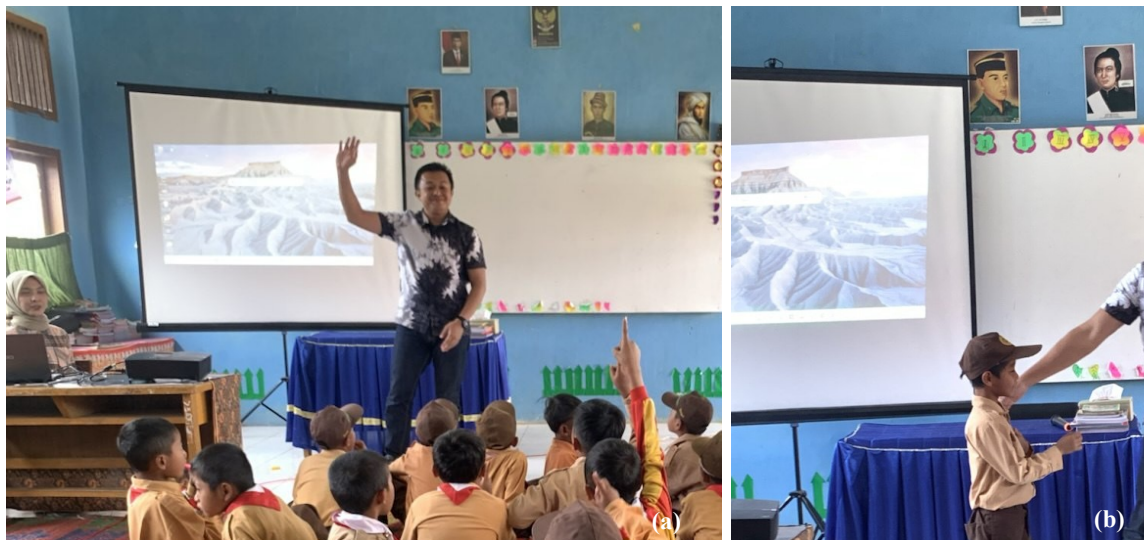
Gambar 4. (a) Siswa Antusias Ingin Menjawab Pertanyaan di Akhir Sesi Kegiatan, (b) Siswa Mencoba Menjawab Pertanyaan.

Survei dilakukan dengan menggunakan angket yang berisi beberapa pertanyaan terkait kepuasan siswa dalam pelaksanaan kegiatan. Hasil survei menunjukkan bahwa sebagian besar siswa merasa puas dengan kegiatan ini, terutama dalam hal pemahaman yang lebih mendalam tentang risiko bencana. Sedangkan berdasarkan hasil observasi, siswa terlihat antusias mengikuti kegiatan dan aktif menjawab pertanyaan di akhir sesi kegiatan yaitu tanya jawab (Gambar 4). Siswa berhasil menjawab setiap pertanyaan yang diberikan terkait kebencanaan dan mitigasinya.