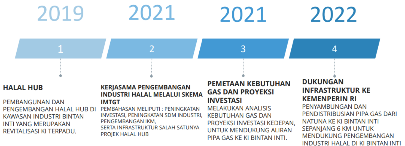
Gambar 2 Milestone Ekosistem Halal di Kepulauan Riau ( 2019-2022)

Sumber Dinas Perindustrian & Perdagangan Kepulauan Riau (2024 )