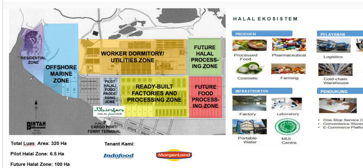
Gambar 2 Area Awal Kawasan Halal Hub ( 320 Ha )