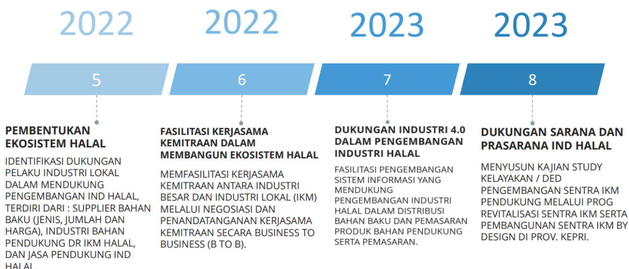
Gambar 3 Milestone Ekosistem Halal di Kepulauan Riau ( 2022-2023)

Sumber Dinas Perindustrian & Perdagangan Kepulauan Riau (2024 )